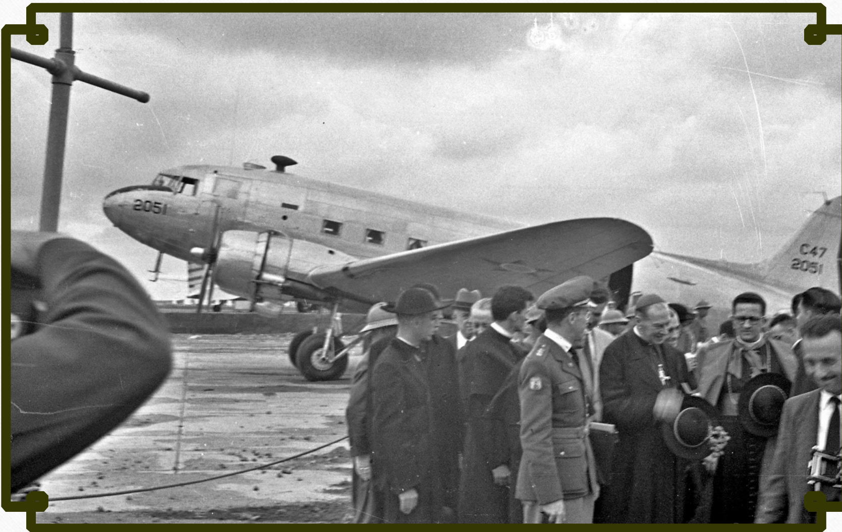
Chegada das autoridades em Congonhas.