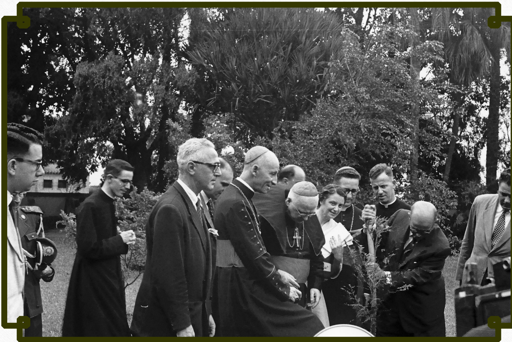
Plantio comemorativo à data em 30 de junho de 1956.