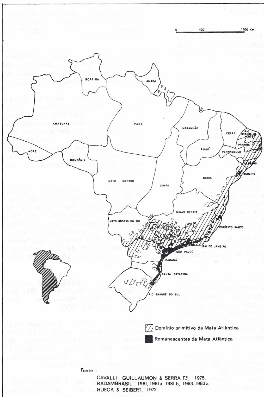
FIGURA 2 - Devastação da Mata Atlântica

Guillaumon, J. R. Mudança do pólo econômico do nordeste para o sudeste, no Brasil, e a destruição da floresta - Mata Atlântica.