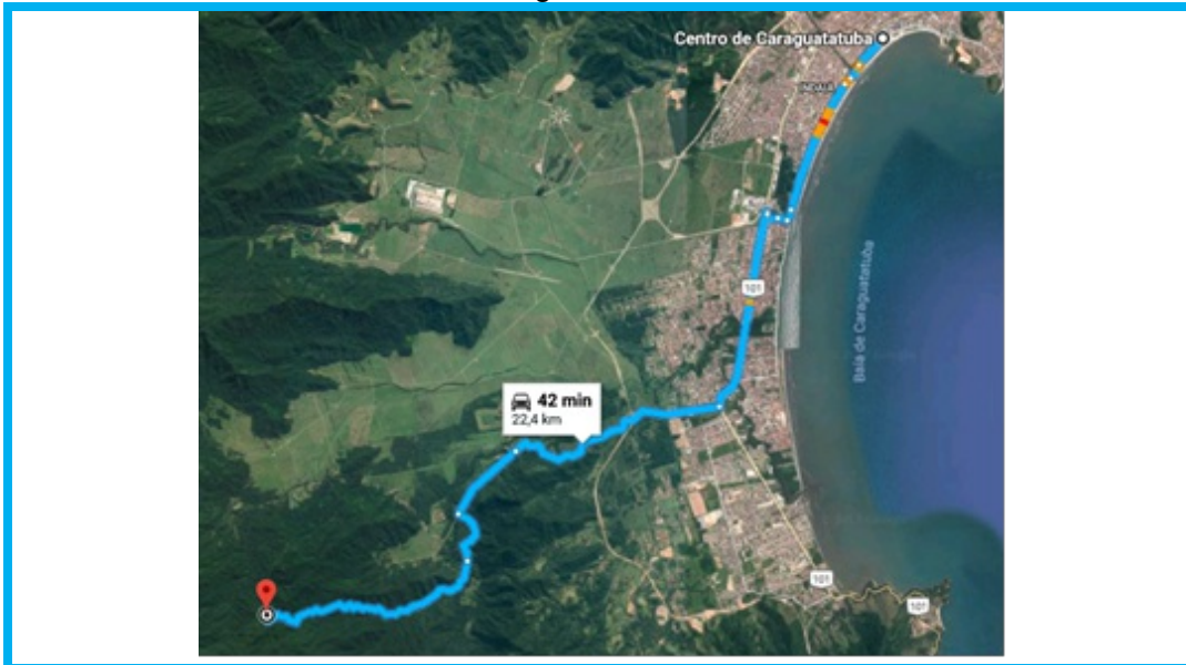
Figura 1 - Roteiro entre o centro de Caraguatatuba e as Obras.

https://www.google.com.br/maps/dir/Centro,+Caraguatatuba+-+SP/-23.7291216,-45.5334361/@-23.6867956,-45.5079649,14223m/data=!3m1!1e3!4m8!4m7!1m5!1m1!1s0x94cd637639eded55:0xff25066e8feadd50!2m2!1d-45.4133322!2d-23.6189379!1m0