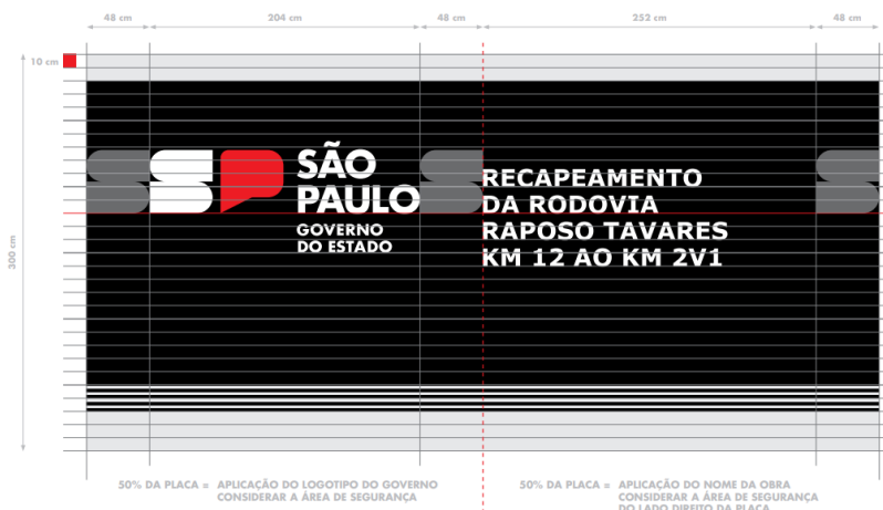
01 PLACA PRINCIPAL

ATENÇÃO: É muito importante respeitar essas proporções, principalmente nos casos em que há necessidade de redução ou ampliação do tamanho-padrão da placa.