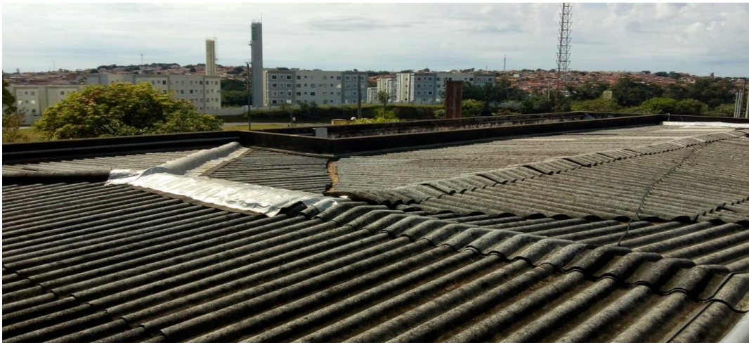
Figura 3- Telhado