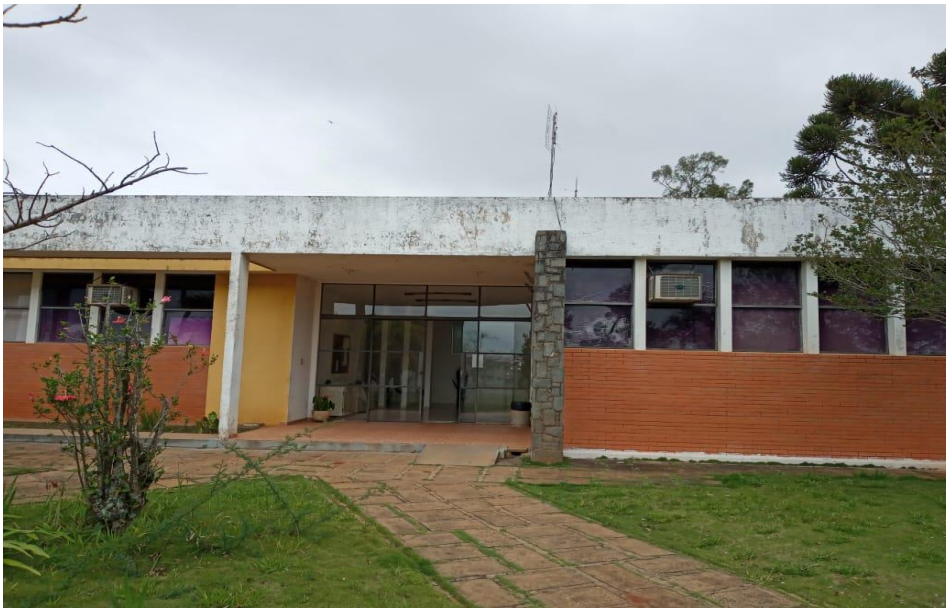
Figura 1- Fachada