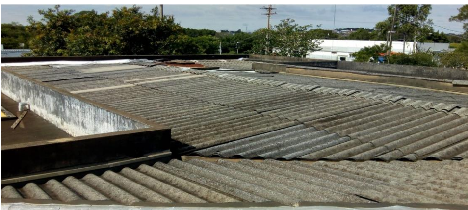
Figura – 2 -Telhado