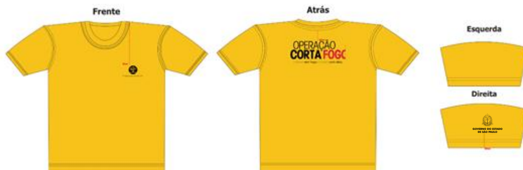
Figura 2 - Modelo da camiseta