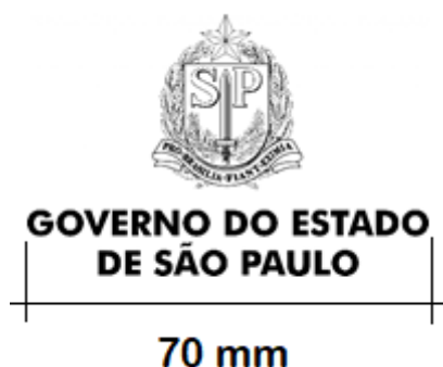
Figura 4 - Logomarca do Estado de São Paulo