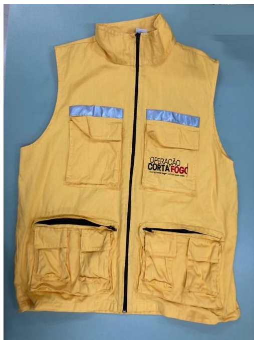
Figura 2 – Parte de trás do colete