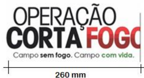
Figura 5 - Logomarca do Programa Corta Fogo