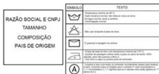
Figura 4 - Modelo das etiquetas

Conterá a razão social e o CNPJ do fabricante, o número do manequim, composição do tecido, País de origem e instruções de lavagem, conforme figura nº 4;