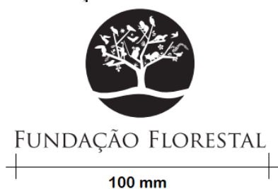
Figura 3 - Logomarca da Fundação Florestal