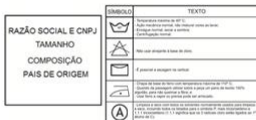
Figura 6 - Modelo das etiquetas

As etiquetas deverão seguir o padrão NBR ISO 3758.