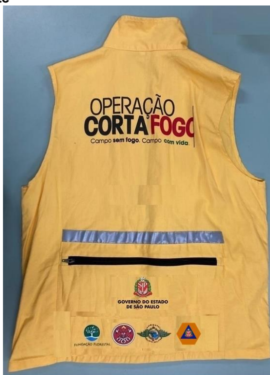
Figura 1 – Parte da frente do colete