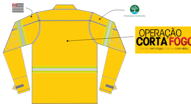
Figura 05 - Vista de trás da gandola masculina