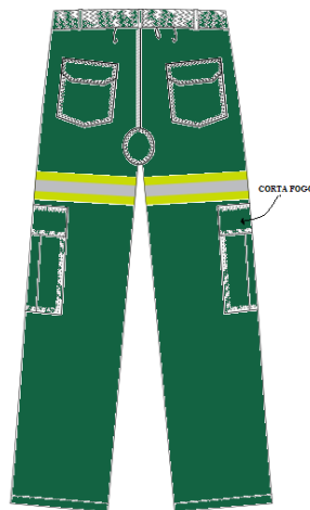
Figura 08 - Vista do traseiro da calça