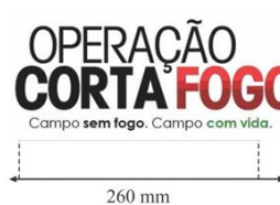
Figura 02 – Logo do Corta Fogo