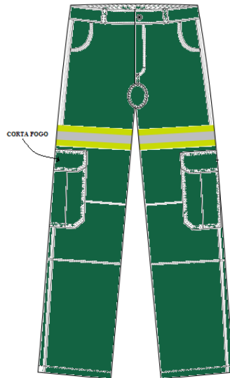
Figura 07 - Vista do dianteiro da calça