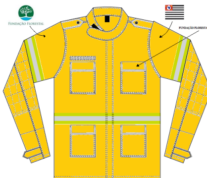
Figura 04 - Vista frontal da Gandola masculina