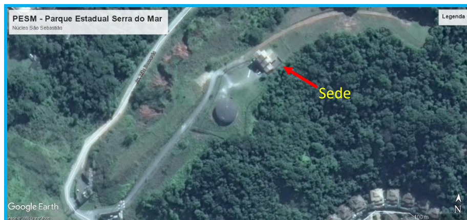
Figura 1: Indicação do local do edifício SEDE

Execução de Obras de Manutenção de Telhado e predial geral no PESM - Parque Estadual Serra do Mar, Núcleo São Sebastião, localizado na Rua Serra do Mar, 13, Juquehy, 11.600-000 São Sebastião.