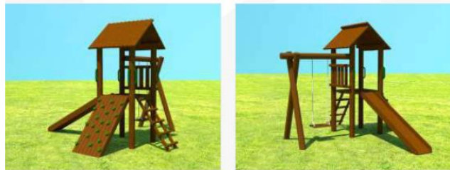
Imagem de referência – Casa do Tarzan Mini - Kaska