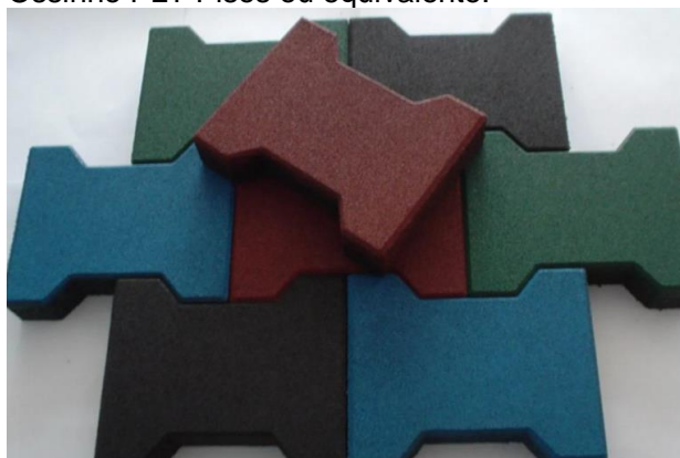
Referência de Pisos no Modelo Ossinho

As peças devem possuir 20cm x 16cm com espessura de 15mm e devem ser fabricadas por empresas que utilizem 100% de material reciclável como insumo da peça, devendo ser demonstrado à FF o compromisso do fornecedor. As borrachas provenientes de inservíveis (exemplo pneus), deverão ser triturados, não retificados. Para completar o processo de fabricação, os retalhos de borracha são entrelaçados e ligados quimicamente, resultando em uma ligação química e mecânica imbatível. Referência Piso Ossinho PLT Pisos ou equivalente.