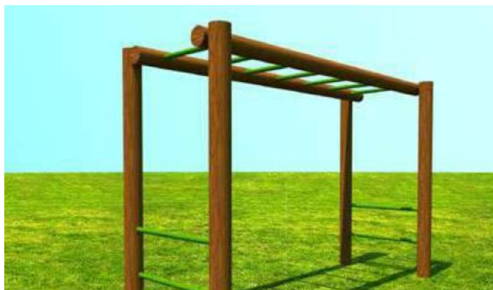
Imagem de referência – Escada Horizontal - Kaska

Todas as madeiras utilizadas deverão ser em eucalipto ou pinus tratados em autoclave com pintura de todas as superfícies em stain com triplo filtro solar. Referência Casa do Tarzan em Mini da Kaska ou equivalente. Remunera também o fornecimento de materiais e mão-de-obra necessários para a execução da fundação e base de apoio para a instalação do conjunto, toda e qualquer peça de ligação e fixação necessárias, conforme projeto final ou recomendações do fabricante.