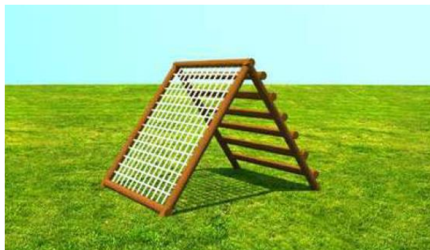
Imagem de referência – Cestão - Kaska

Todas as madeiras utilizadas deverão ser em eucalipto ou pinus tratados em autoclave com pintura de todas as superfícies em stain com triplo filtro solar. Referência Cestão da Kaska ou equivalente. Remunera também o fornecimento de materiais e mão-de-obra necessários para a execução da fundação e base de apoio para a instalação do conjunto, toda e qualquer peça de ligação e fixação necessárias, conforme projeto final ou recomendações do fabricante.