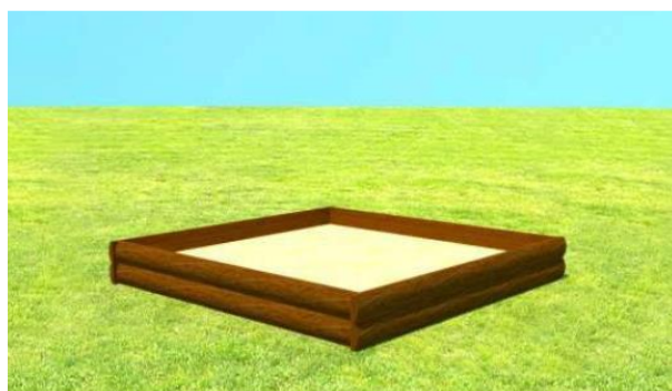
Imagem de referência – Caixa de Areia

Todas as madeiras utilizadas deverão ser em eucalipto ou pinus tratados em autoclave com pintura de todas as superfícies em stain com triplo filtro solar. Remunera também o fornecimento de materiais e mão-de-obra necessários para a execução da fundação e base de apoio para a instalação do conjunto, toda e qualquer peça de ligação e fixação necessárias, conforme projeto final ou recomendações do fabricante.