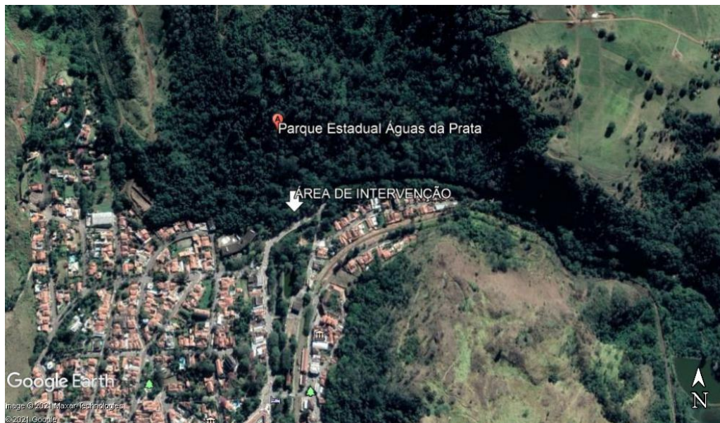
Figura 1 – Local de intervenção na UC

Trata-se de acesso realizado por rodovias e vias pavimentadas com fácil trânsito de veículos leves e pesados.