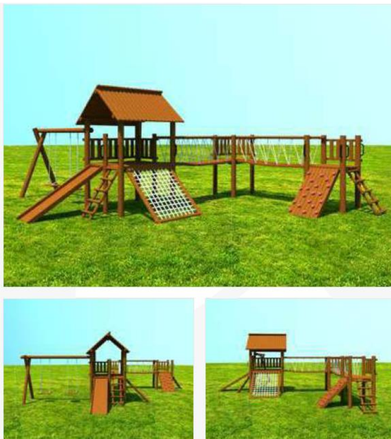
Imagem de referência: modelo Casa do Tarzan em L – Kaska