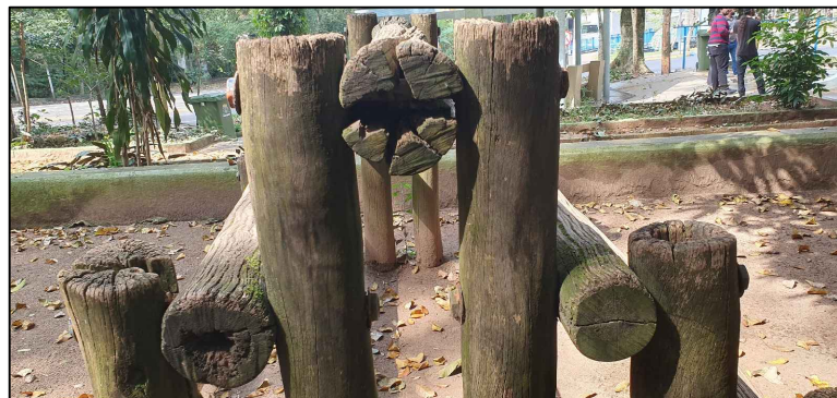
BRINQUEDOS CONDENADOS QUE SERÃO RETIRADOS