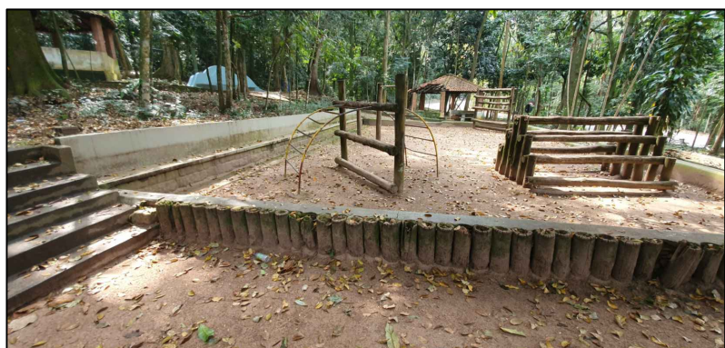
ACESSO PARA PORTÃO E LIMITE DO FECHAMENTO