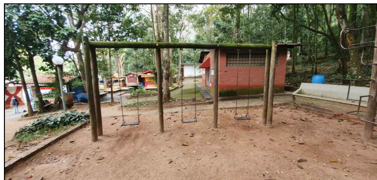
BRINQUEDOS CONDENADOS QUE SERÃO RETIRADOS