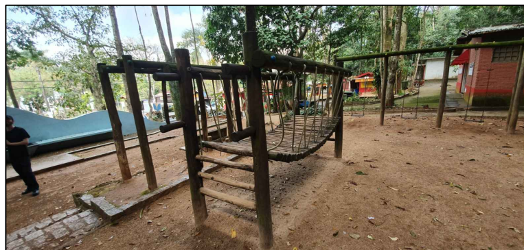
BRINQUEDOS CONDENADOS QUE SERÃO RETIRADOS