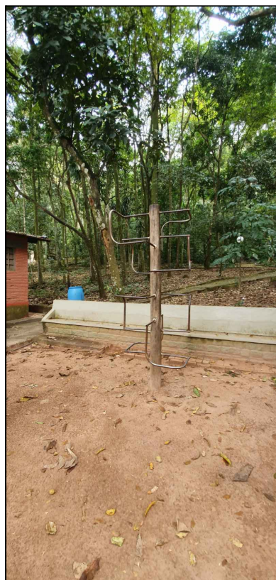
LIMITE QUE SERÁ INSTALADO FECHAMENTO