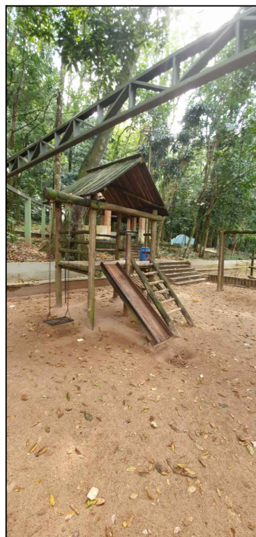
BRINQUEDOS CONDENADOS QUE SERÃO RETIRADO