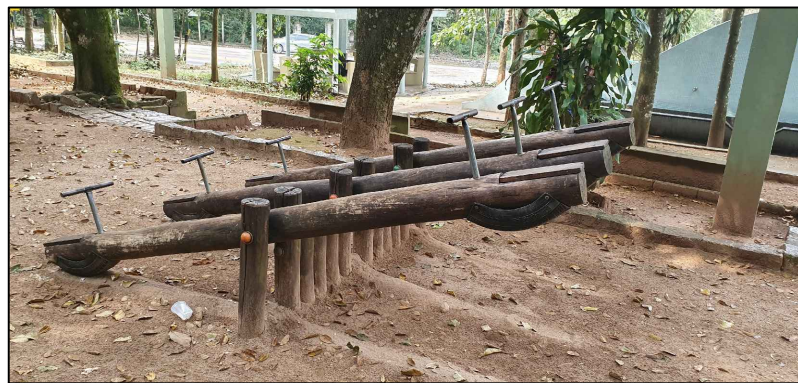
BRINQUEDOS CONDENADOS QUE SERÃO RETIRADOS