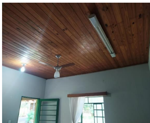
Lâmpada com problemas no reator S 21° 50' 55,7" W 47° 25' 34,0"