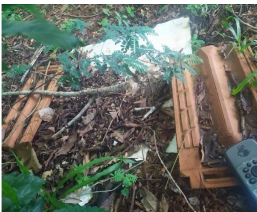
Fossa vedada com MDF e telhas S 21° 50' 34,0" W 47° 25' 21,3"