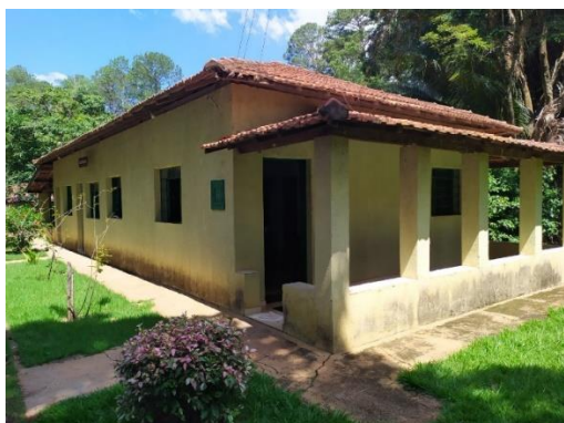
SEDE ADMINISTRATIVA prédio nº 2 S 21° 50' 33,9" W 47° 25' 21,1"

Cabe ressaltar que os edifícios atendem diariamente 08 funcionários diretos, inclusive prestando suporte aos Parques de Vassununga e Águas da Prata. O Alojamento está sendo utilizado como refeitório pelos funcionários, e como hospedaria para a equipe de manejo de produtos florestais e outros técnicos da DMI, inclusive nos períodos de estiagem como abrigo para as equipes da Operação Corta Fogo.