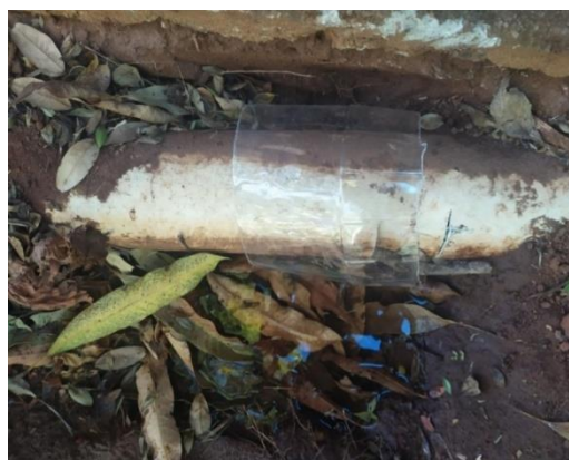
ALOJAMENTO Canos de esgoto