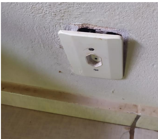
Tomada apresentando curto circuito S 21° 50' 55,7" W 47° 25' 34,0"