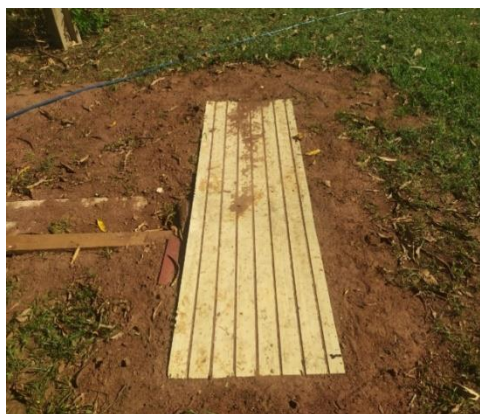
Encanamento: Vedação improvisada S 21° 50' 35,0" W 47° 25' 21,0"