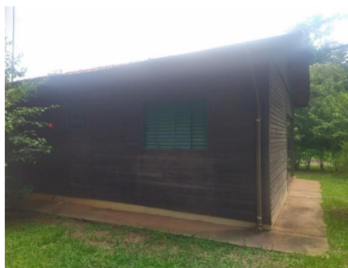
ALOJAMENTO prédio nº 6 S 21° 50' 33,2" W 47° 25' 20,8"