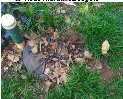
SEDE ADMINISTRATIVA- Fossa séptica deteriorados