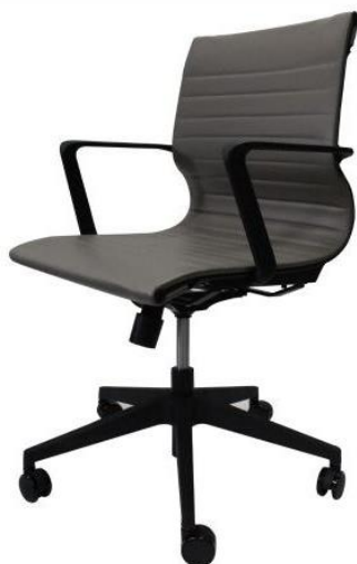
Figura 2 - Características visuais obrigatórias da cadeira

A cadeira deverá ter minimamente a capacidade peso máximo suportado em 130kg. As tolerâncias de dimensão para a cadeira será de 2% do que está apresentado.Referência : Cadeira Gerente Olímpia Cinza E-Cadeiras ou Similar.