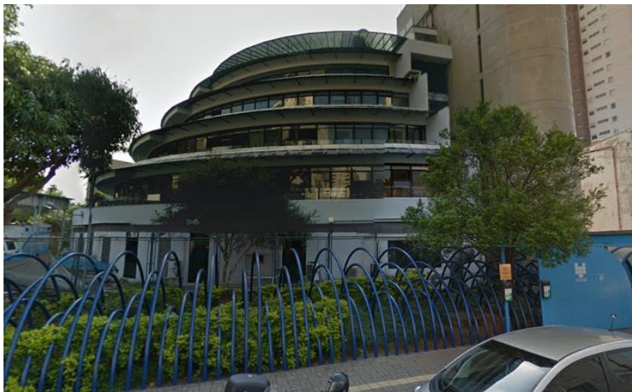
Figura 1 – Local para a entrega dos mobiliários, fachada do prédio.

Aquisição de mobiliário - cadeiras, para sede da Fundação Florestal, situada à Av. Professor Frederico Hermann Jr., 345 – prédio 12, 1º andar, Pinheiros, 05459-010 São Paulo.