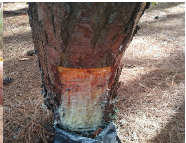
Figura 4. Confeção de várias estrias.

3.29. TODAS AS ATIVIDADES DE MANEJO FLORESTAL NECESSÁRIAS À IMPLANTAÇÃO DA RESINAGEM DEVERÃO SER REALIZADAS DE ACORDO COM AS ESPECIFICAÇÕES TÉCNICAS PARA EXTRAÇÃO DE GOMA RESINA EM ÁREAS NOVAS, ÁREAS VELHAS E ÁREAS MAIS VELHAS COM PINUS ELLIOTTII VAR. ELLIOTTII , DO ITEM. 03.