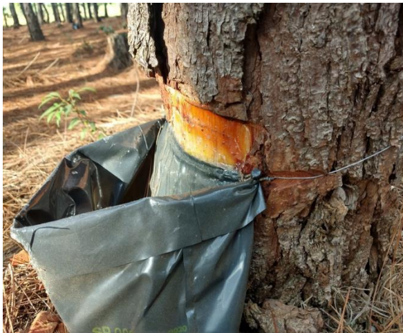
Figura 1. Instalação e fixação do saquinho.