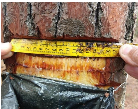
Figura 3. Medição da largura do painel.