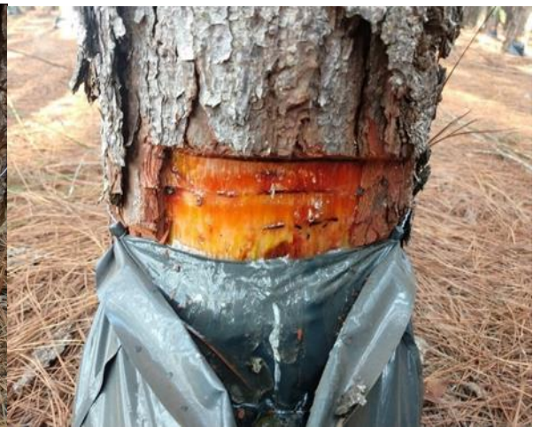
Figura 2. Confeção do painel.