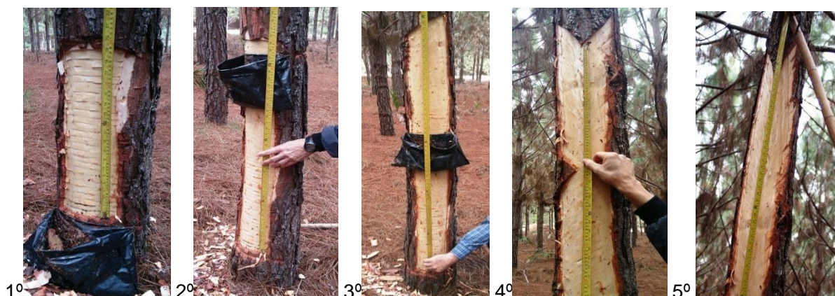
Figura 1. Sequência de confecção dos painéis de resinagem.

3.12. O comprimento das estrias deverá ser de no máximo 15 (quinze) centímetros , visando evitar os possíveis danos irreversíveis ao stand pela sobreexploração dos painéis, essa medida visa a garantir a sustentabilidade da produção, para todas as Unidades com os respectivos lotes da TABELA Nº1.