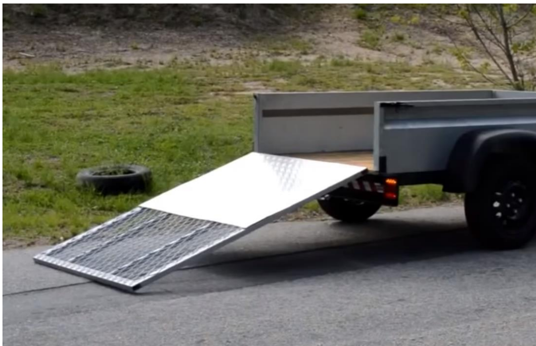
Figura 2 – Imagem ilustrativa da tampa basculante para carretinha

O movimento basculante da caçamba será realizado através de guincho manual catracado em aço galvanizado, com cabo de aço contendo no mínimo 9m e gancho em aço forjado, este guincho deverá suportar cargas de trabalho de pelo menos 1.000kg, a catraca deverá dispor de dispositivo de segurança para travamento do cabo. Para erguer a caçamba o cabo deverá passar por roldana em aço que estará ligada a um “varal” (peça em aço vertical que estará conectada ao chassi da carretinha através de um pivô), este varal por não estar fixo a estrutura da carretinha irá permitir a correção angular que se fará necessária no movimento de erguer a caçamba. Quando da caçamba em repouso deverá haver fecho de ação rápida com porta cadeado para travamento não permitindo que esta se movimente durante o deslocamento em estrada e/ou vias diversas. O varal deverá possuir estabilidade e resistência aos esforços laterais, pois o sistema de içamento da caçamba também será utilizado para içamento de cargas (arraste de carga) para dentro da caçamba.