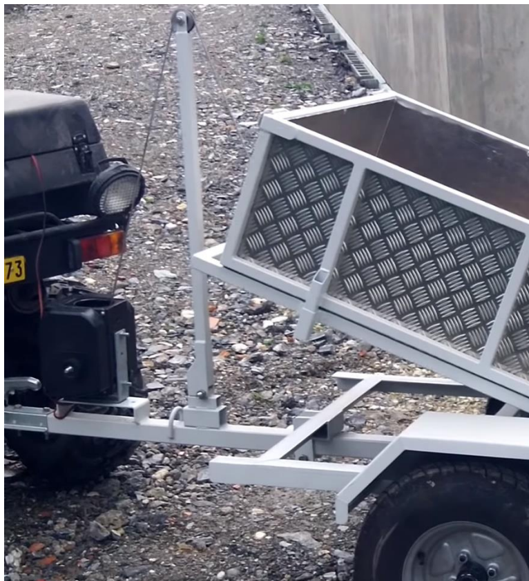
Figura 4 – Imagem ilustrativa do “varal”