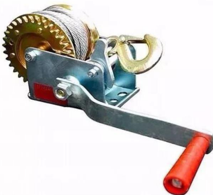
Figura 3 – Guincho tipo catraca manual com cabo e gancho

O movimento basculante da caçamba será realizado através de guincho manual catracado em aço galvanizado, com cabo de aço contendo no mínimo 9m e gancho em aço forjado, este guincho deverá suportar cargas de trabalho de pelo menos 1.000kg, a catraca deverá dispor de dispositivo de segurança para travamento do cabo. Para erguer a caçamba o cabo deverá passar por roldana em aço que estará ligada a um “varal” (peça em aço vertical que estará conectada ao chassi da carretinha através de um pivô), este varal por não estar fixo a estrutura da carretinha irá permitir a correção angular que se fará necessária no movimento de erguer a caçamba. Quando da caçamba em repouso deverá haver fecho de ação rápida com porta cadeado para travamento não permitindo que esta se movimente durante o deslocamento em estrada e/ou vias diversas. O varal deverá possuir estabilidade e resistência aos esforços laterais, pois o sistema de içamento da caçamba também será utilizado para içamento de cargas (arraste de carga) para dentro da caçamba.