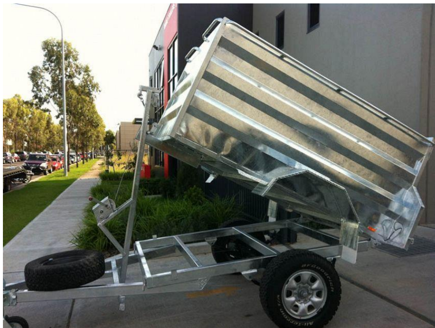
Figura 6 – Imagem ilustrativa caçamba basculante com sistema de guincho

A carreta deverá ter capacidade de carga mínima igual a 500kg e contar com munheca de acoplamento rápido com capacidade de tração mínima igual a 2.500kg, deverá ainda conter pedestal com roda em rodízio giratório com capacidade compatível com a máxima carga aplicável quando a carreta estiver em repouso.