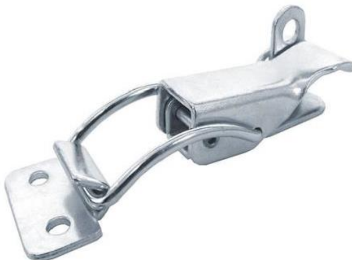
Figura 5 – Fecho rápido com porta cadeado