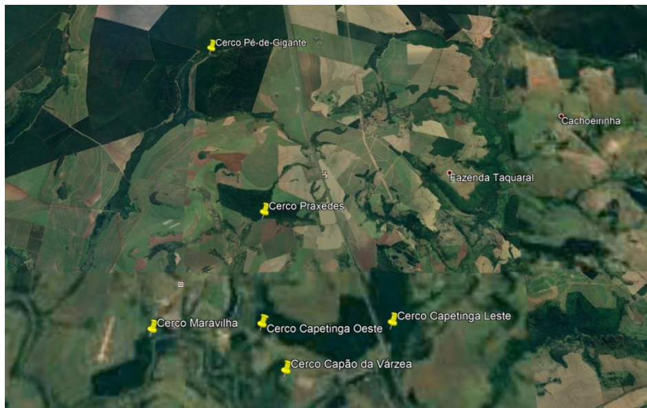
Figura 2 – Distribuição dos Cercos (Google Earth)