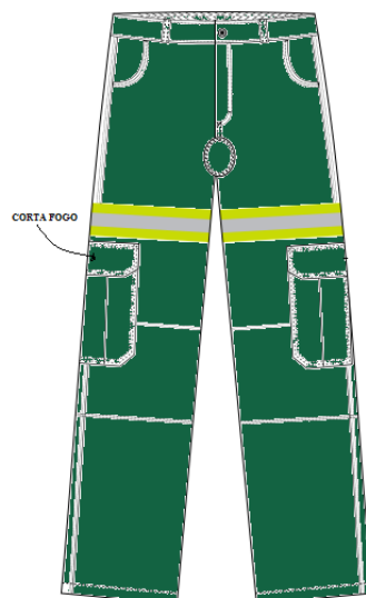
Figura 07 - Vista do dianteiro da calça