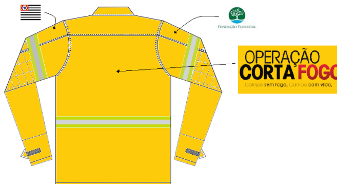
Figura 05 - Vista de trás da gandola masculina