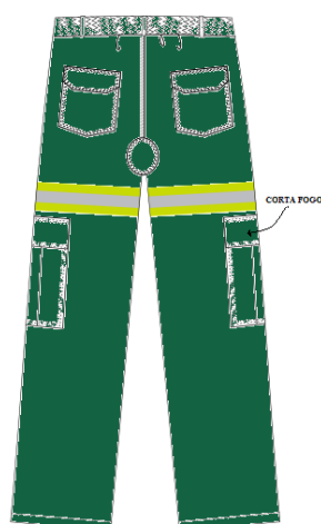
Figura 08 - Vista do traseiro da calça