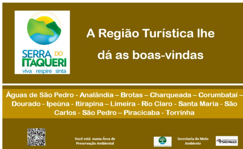
Referência visual da mensagem das placas Modelo 1.