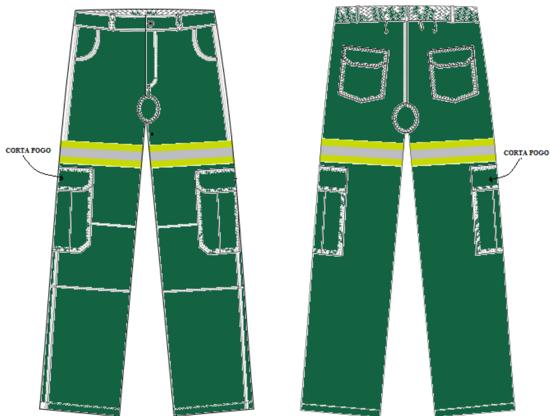
Tabela de Medida da Calça em Centímetro