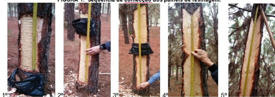
FIGURA 1. Sequência de confecção dos painéis de resinagem.

3.8. Na instalação dos painéis da segunda face deverá ser observado os seguintes critérios: