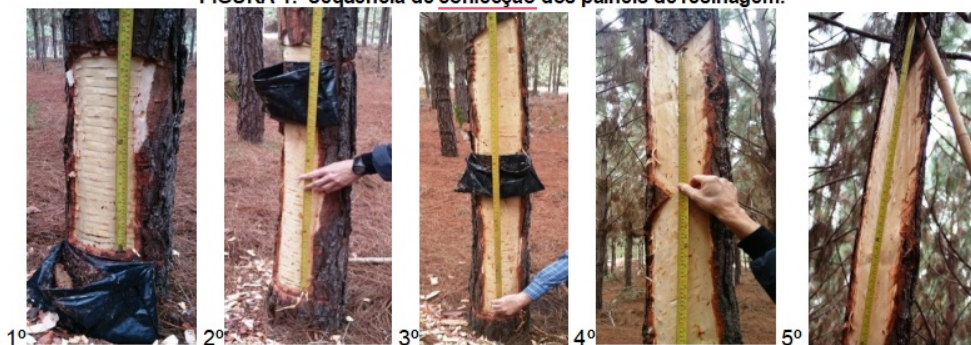
FIGURA 1. Sequência de confecção dos painéis de resinagem.

3.8. Na instalação dos painéis da segunda face deverá ser observado os seguintes critérios: