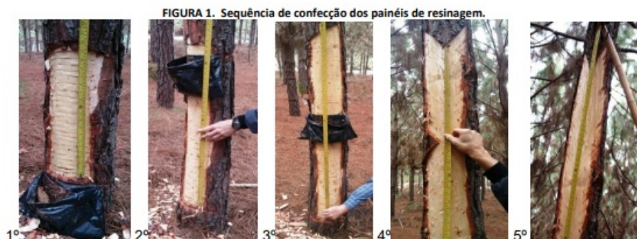
FIGURA 1. Seq ncia de confec o dos pain is de resinagem.

3.8. Na instala o dos pain is da segunda face dever  ser observado os seguintes crit rios: