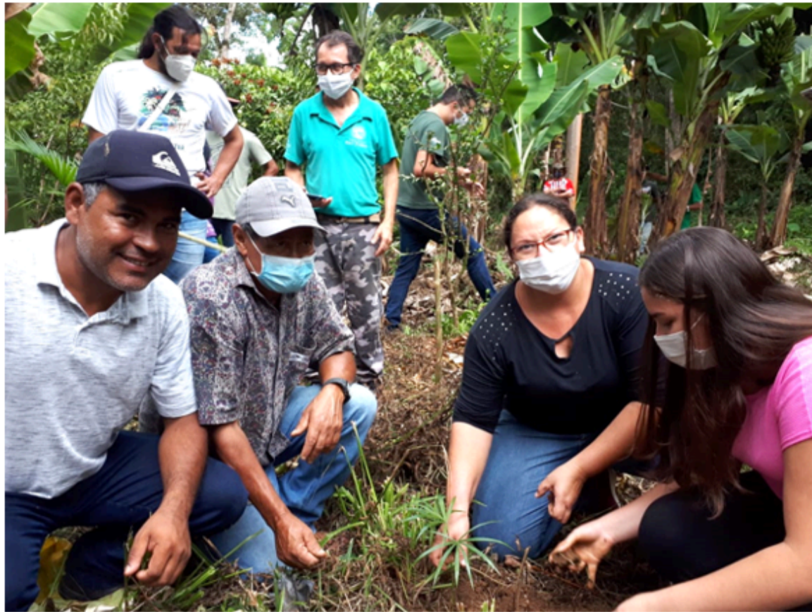
Provedores de serviços ambientais da primeira edição do PSA Juçara, na região do Vale do Ribeira, em 2021.

A Fundação Florestal pretende publicar novos Editais de Chamamento Público periodicamente para credenciamento de novos provedores de serviços ambientais em diferentes regiões (acesse os Editais na íntegra em Como participar).