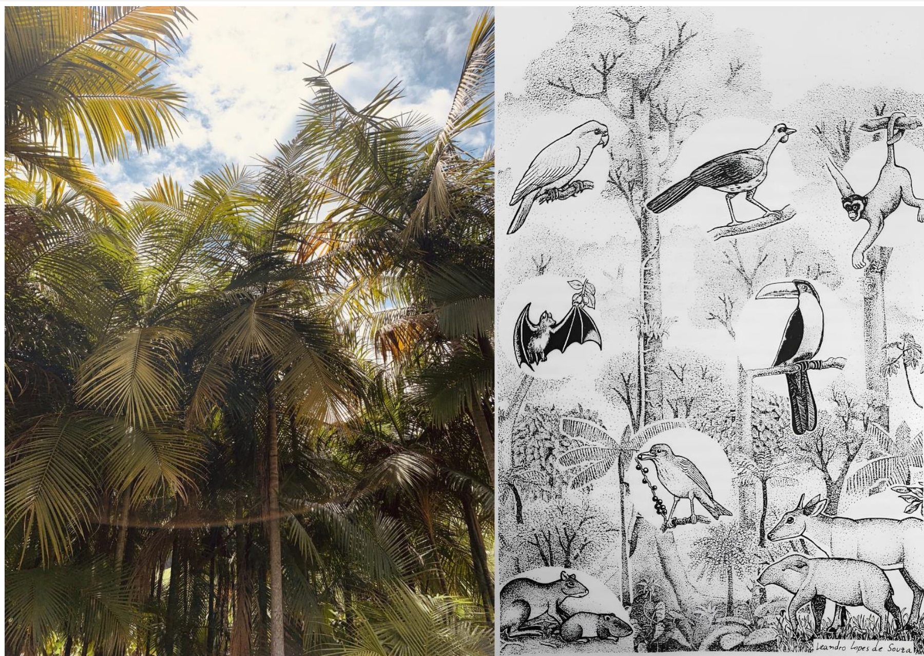
Na esquerda, palmeira juçara na propriedade de um credenciado em Paraibuna, SP; A direita, figura com alguns dos animais que se alimentam da juçara (Reis & Kageyama, "Euterpe edulis Martius (Palmitero) – Biologia, Conservação e Manejo", 2000).

A juçara é uma palmeira chave na Mata Atlântica que alimenta cerca de 70 animais da floresta. Devido à exploração descontrolada dela, para a retirada de palmito, tornou-se restrita a poucas Unidades de Conservação (UCs) e Áreas Protegidas particulares, entrando na lista de espécies ameaçadas de extinção.