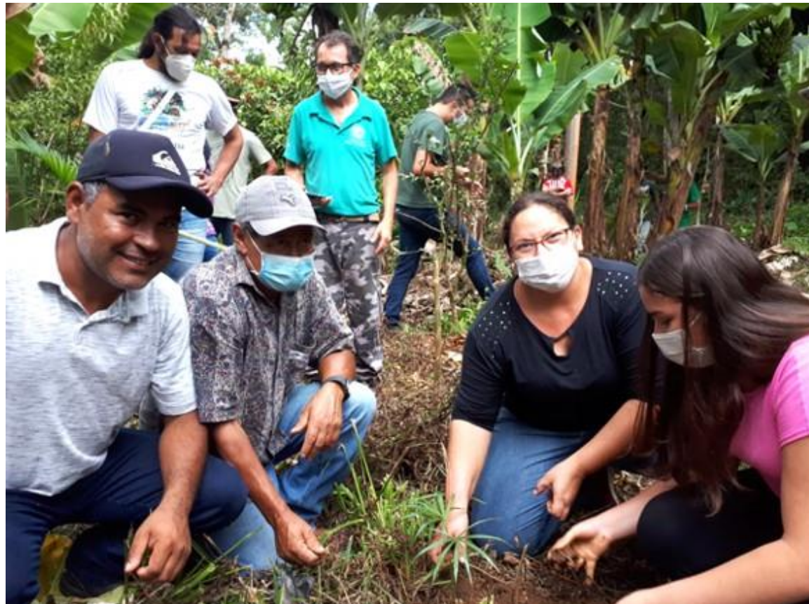
Provedores de serviços ambientais da primeira edição do PSA Juçara, na região do Vale do Ribeira, em 2021.

A Fundação Florestal pretende publicar novos Editais de Chamamento Público periodicamente para credenciamento de novos provedores de serviços ambientais em diferentes regiões (acesse os Editais na íntegra em Como participar).