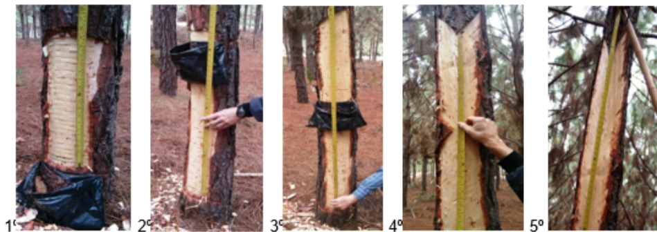
FIGURA 1. Sequência de confecção dos painéis de resinagem.

3.8. O comprimento das estrias deverá ser de no máximo 18 (dezoito) centímetros, visando evitar os possíveis danos irreversíveis ao stand pela sob exploração dos painéis, essa medida visa a garantir à sustentabilidade da produção.