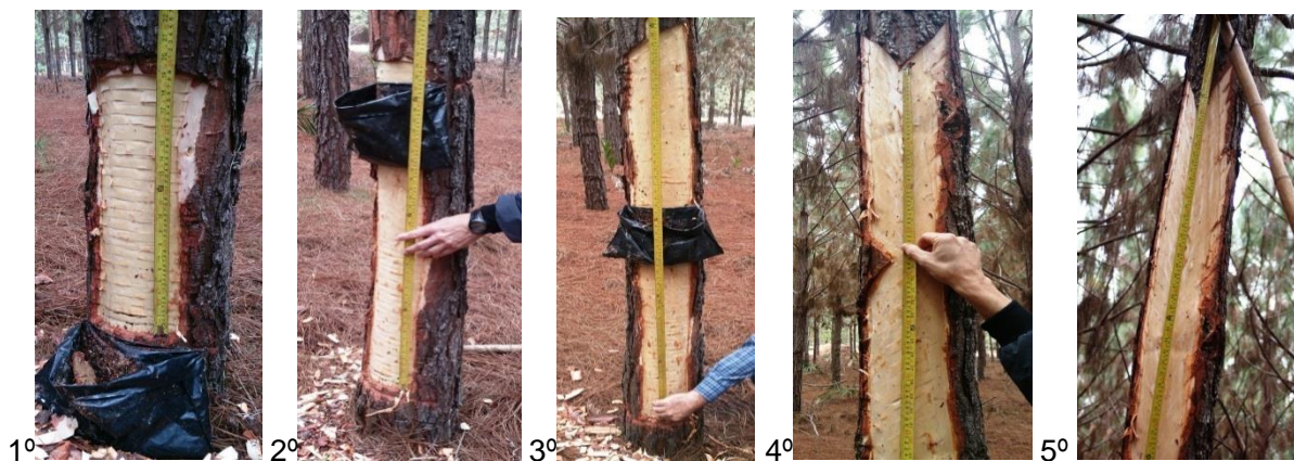
FIGURA 1. Sequência de confecção dos painéis de resinagem.

3.10. O comprimento das estrias deverá ser de no máximo 18 (dezoito) centímetros, visando evitar os possíveis danos irreversíveis ao stand pela sob exploração dos painéis, essa medida visa a garantir a sustentabilidade da produção.