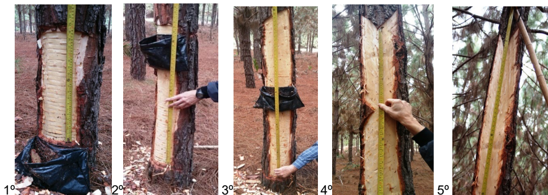
FIGURA 1. Sequência de confecção dos painéis de resinagem.

3.6. A limpeza da casca para a instalação dos painéis não poderá ferir o lenho das árvores .