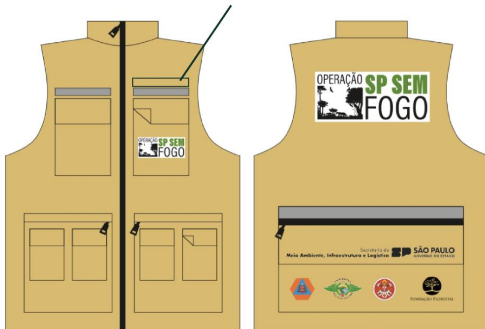
Imagens ilustrativas do colete de referência, frente e costas: