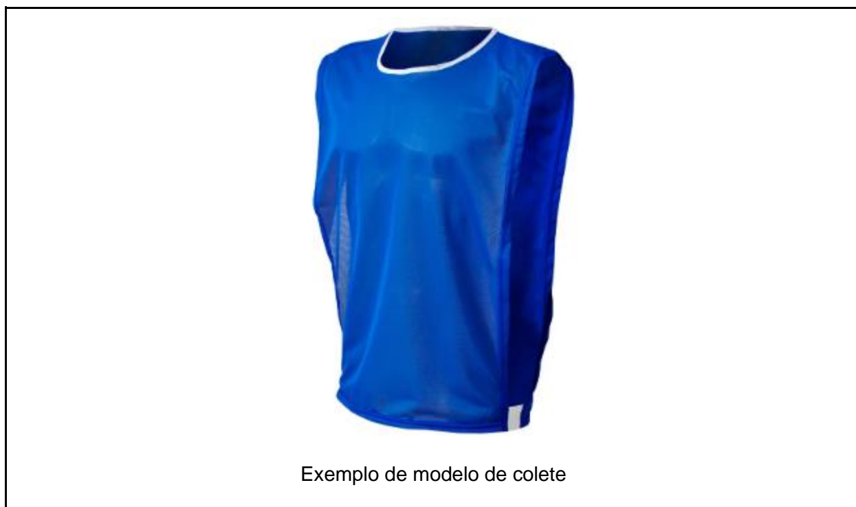
Exemplo de modelo de colete