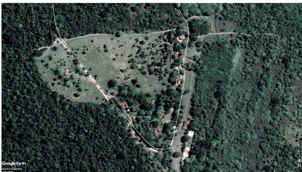
Figura 1– visão geral de área de uso público do PEMD