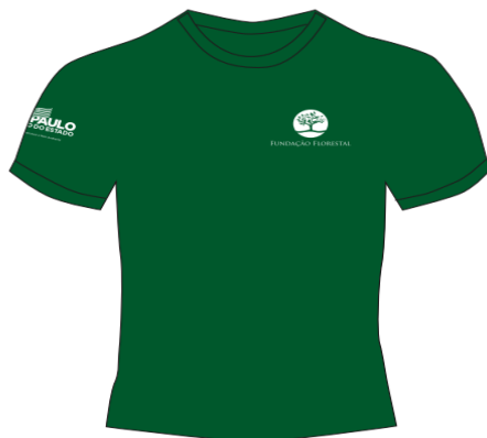
Cor: Pantone 553C