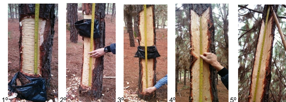
Figura 1. Sequência de confecção dos painéis de resinagem.