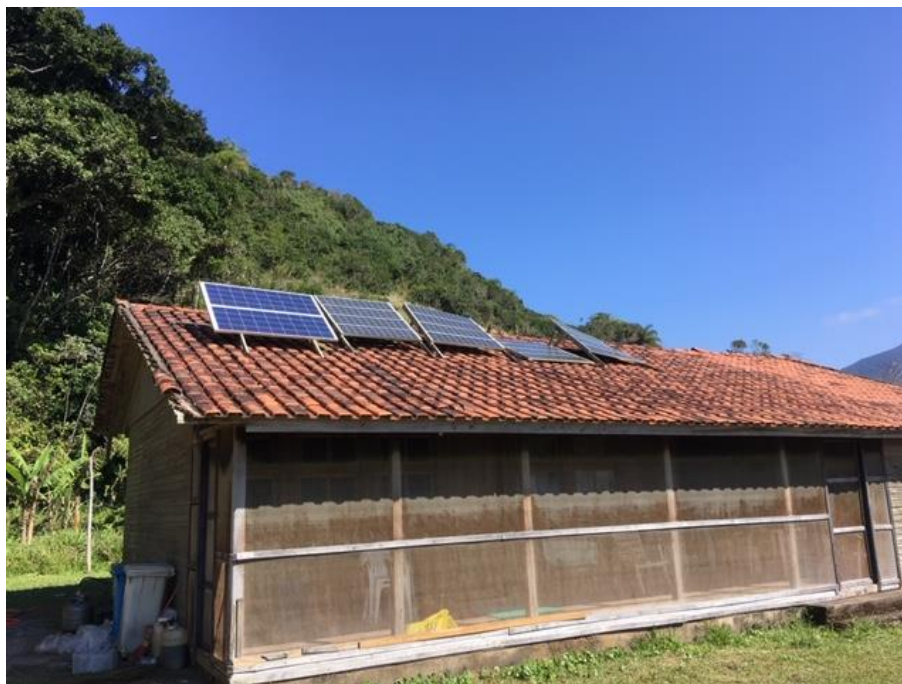
Foto 1 - Vista da edificação da Base Grajauna