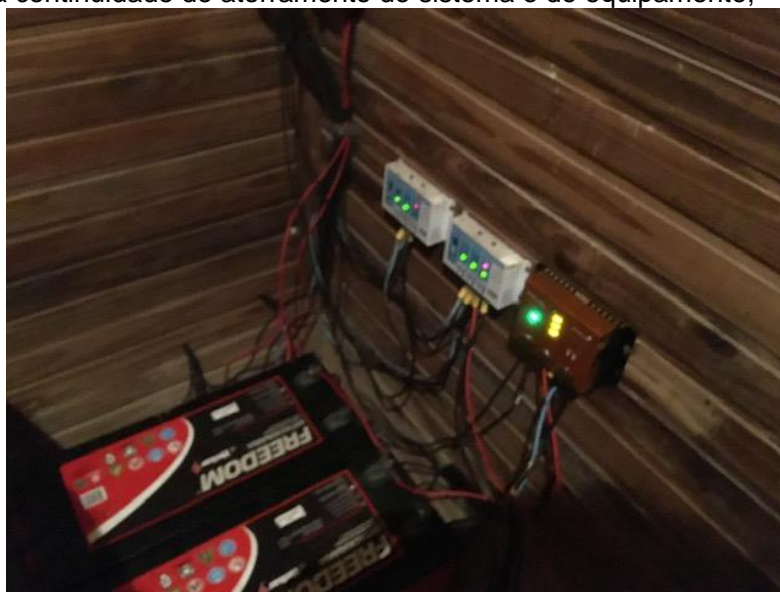
Foto 08 – Vista dos controladores de carga instalados na edificação

Para o banco de baterias deverá ser construído um abrigo em alvenaria com tijolo maciço com estantes de concreto, ventilação permanente com blocos vazados tipo veneziana, portão tipo gradil com lâmina em chapa de aço revestido com zinco e acabamento da alvenaria com revestimento em argamassa polimérica para armazenar seis baterias estacionárias fotovoltaicas.