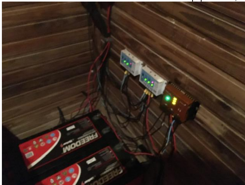
Foto 08 – Vista dos controladores de carga instalados na edificação

Para o banco de baterias deverá ser construído um abrigo em alvenaria com tijolo maciço com estantes de concreto, ventilação permanente com blocos vazados tipo veneziana, portão tipo gradil com lâmina em chapa de aço revestido com zinco e acabamento da alvenaria com revestimento em argamassa polimérica para armazenar seis baterias estacionárias fotovoltaicas.