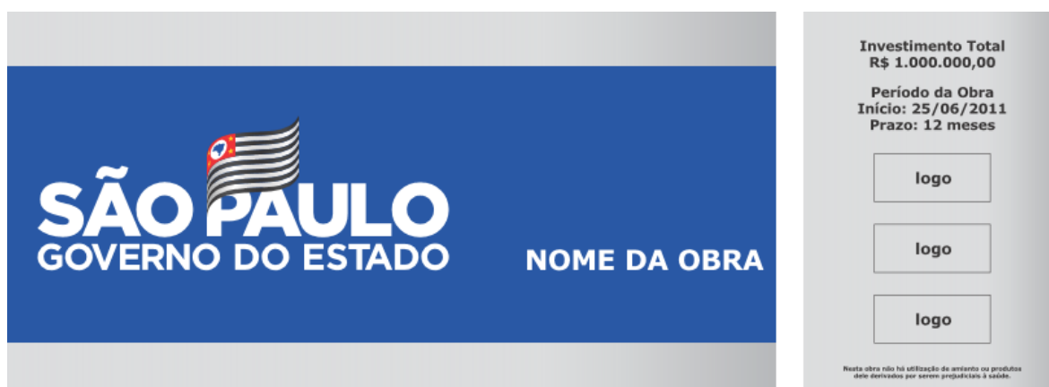
Figura 02 – Modelo de placa de obra

As placas de identificação da Contratada e de eventuais consultores e firmas especializadas deverão ter suas dimensões e modelo gráfico submetidas à aprovação da fiscalização, que determinará, também, o seu posicionamento no canteiro de serviços. As informações detalhadas e arquivos para impressão da comunicação visual do Estado poderão ser consultadas em: http://www.comunicacao.sp.gov.br/manual-de-identidade-visual/