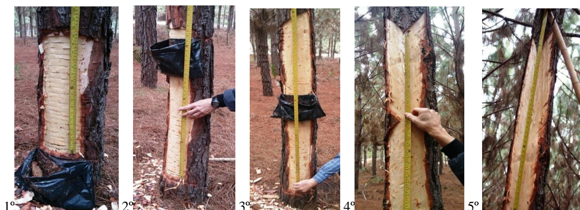
Figura 1. Sequência de confecção dos painéis de resinagem.