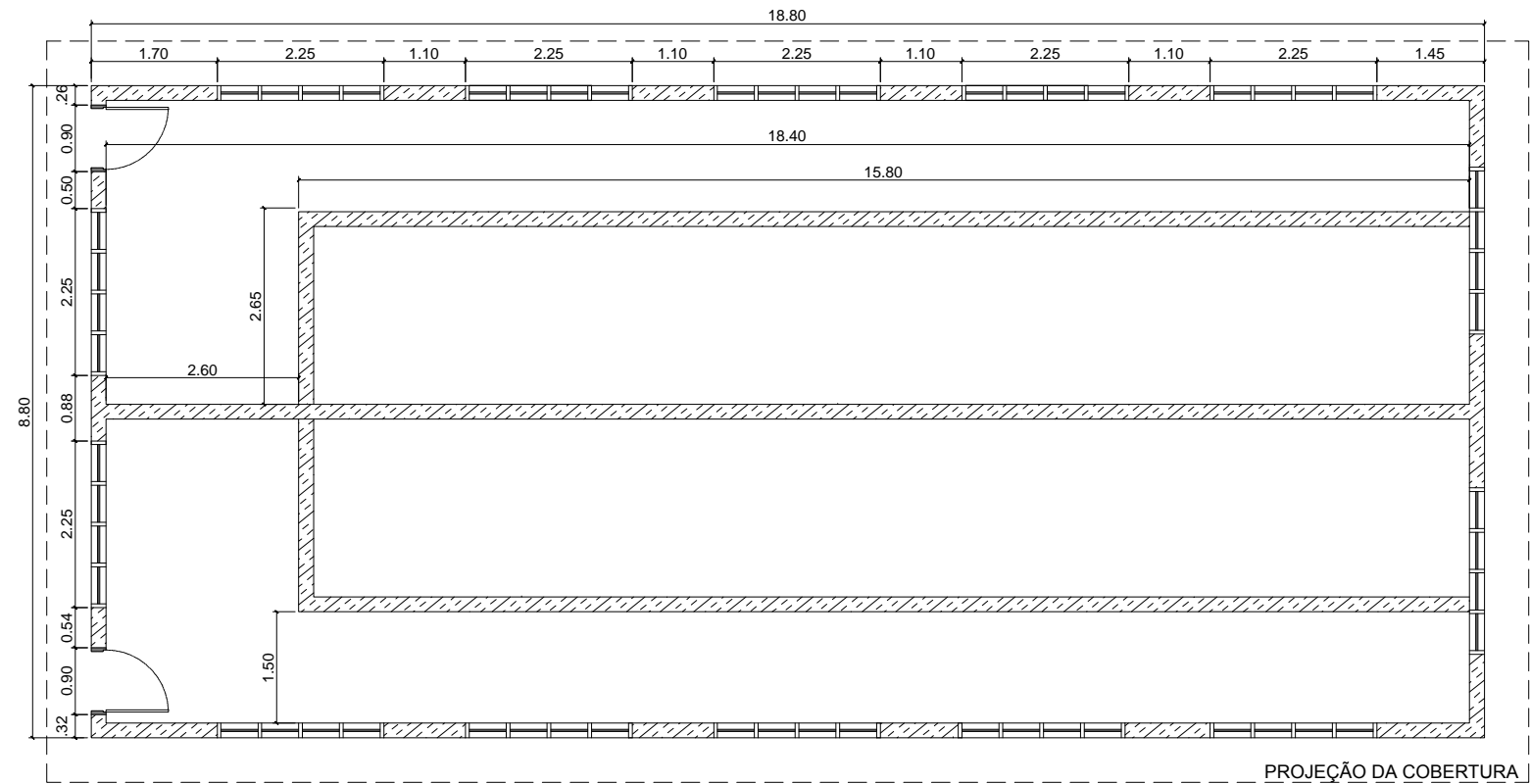
PLANTA SANITÁRIOS CONSTRUÇÃO EXISTENTE