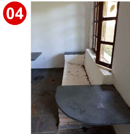
O piso e as paredes encontram-se sujos e desgastados.