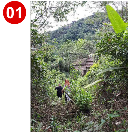
A estrada de acesso encontra-se bloqueada por vegetação impossibilitando o acesso pleno a base de pesquisa.