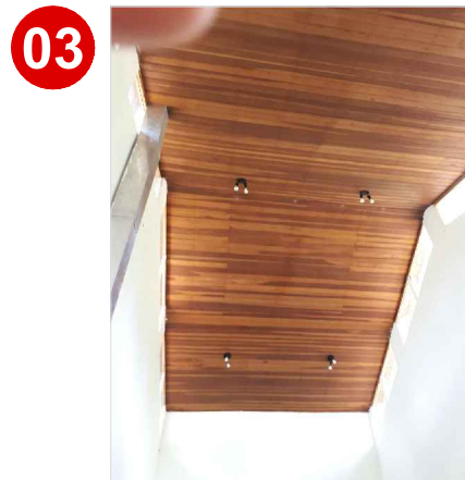
Algumas peças do forro encontram-se quebradas. Principalmente nos dormitórios.