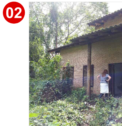
Todo o entorno da edificação encontra-se tomado pela vegetação que não vem sendo podada e o entorno mantido.