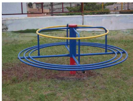
Carrossel 1,60Ø ass. Tubular (2,90alt x 5,50larg x 3,50comp) R$ 4.490,00