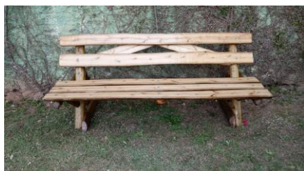
Banco Rustico - R$ 710,00 (1,00alt x 0,80larg x 1,50comp)