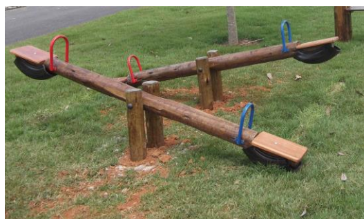
Gangorra 2 pranchas – Eucalipto R$ 690,00 (0,50alt x 1,00larg x 2,50comp)