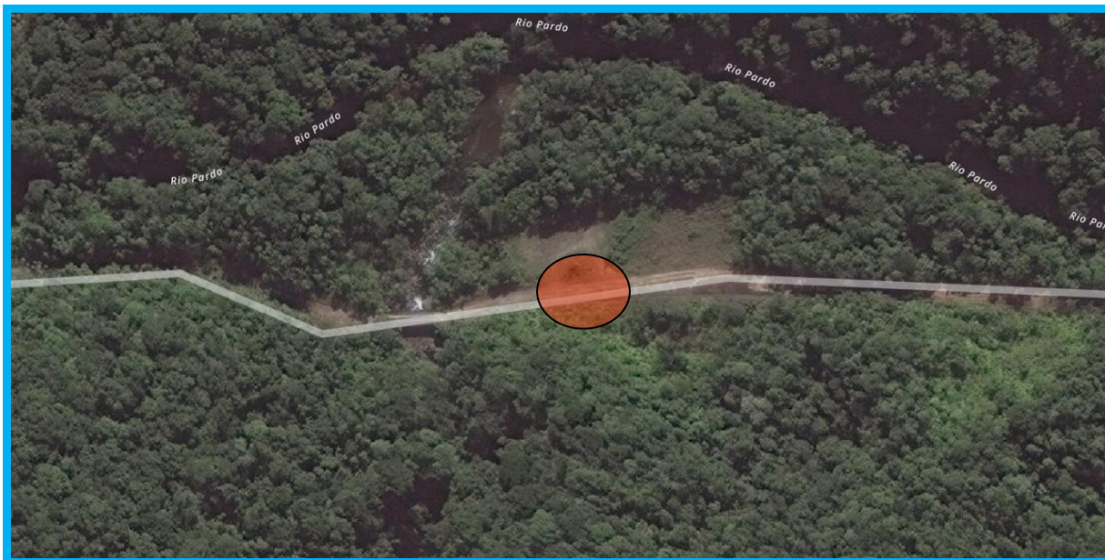
Figura 1 - Vista aérea do local de implantação

Contratação serviços de obras - Implantação de Sanitários/Vestiários - Parque Estadual Serra do Mar - Núcleo Caraguatuba.