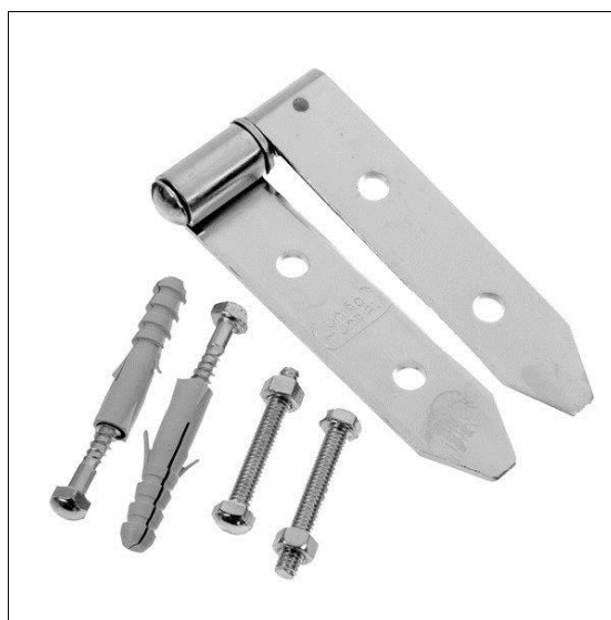
Figura 5 - exemplo de dobradiça para portão em aço galvanizado

Dobradiças: deverão ser todas em aço galvanizado sendo de, no mínimo duas por folha com 6" e fixadas com parafusos galvanizados em quantidade análoga às exigidas pelo fabricante.