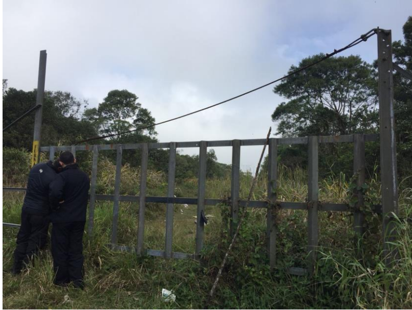
Figura 1 - exemplo de como deverá ser o portão

Montantes: chapas de 7mm de espessura dobradas em "U" para que se obtenha dimensão final 10cm x 03cm, devendo estar os montantes espaçados de, no máximo, 30 cm.