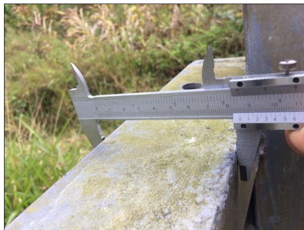
Figura 2 - dimensão das peças

Travessas horizontais: ao mínimo três travessas de mesmo material de dimensões 10cm x 10cm.