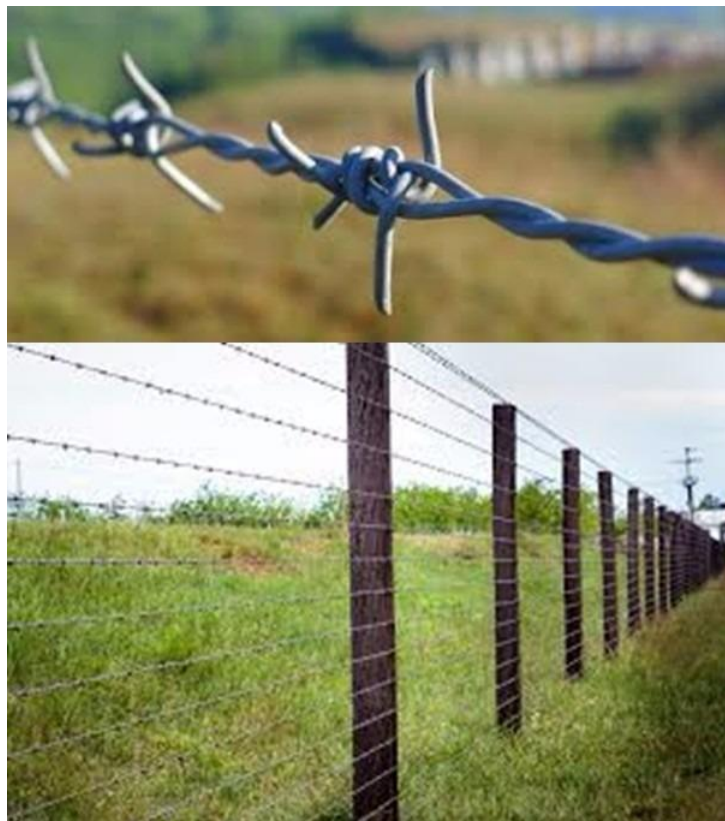
Figura 7 - exemplo de cerca

As cercas serão instaladas em dimensões conforme necessidade específica de cada local a fim de serem garantidos os objetivos de impedimentos de acesso nos locais definidos.