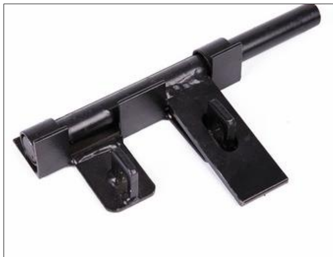
Figura 4 exemplo de fecho passante para cadeado

Cadeado: deverá ser fornecido pela empresa um cadeado para cada fechamento executado, devendo ser de nível de segurança mínimo 6 conforme orientações da ANBT NBR 15271.