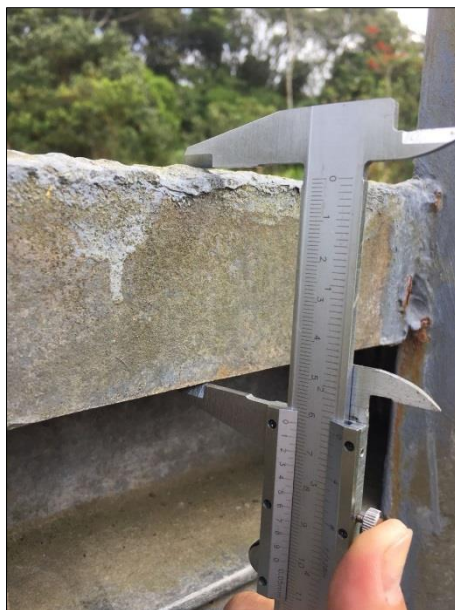
Figura 3 - dimensão das peças

Soldas: todos os elementos deverão ser soldados entre si respeitando as normas e as resistências mínimas estipuladas.