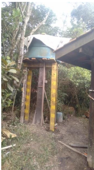
Figura 7 – Condições da caixa d'água existente