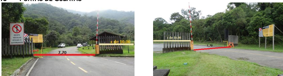
Figura 3 e 4 – Área de para instalação de Portão Elétrico em Cubatão