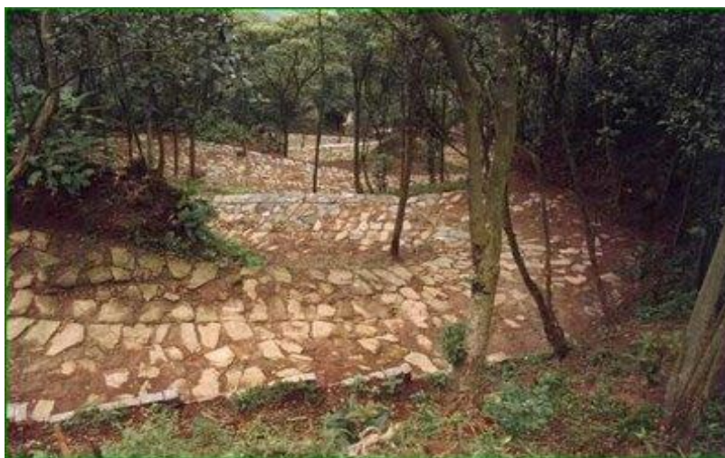
Figura 02 – Calçada do Lorena