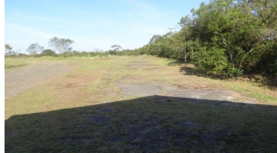
Figura 3 e 4 – Área de para instalação de caixa d'água ao lado do CAV São Bernardo do Campo