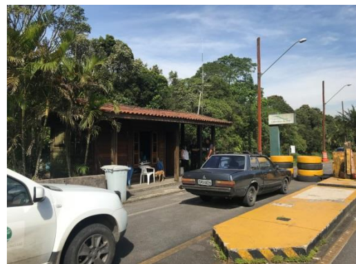
Figura 5 e 6 - Guarita de São Bernardo do Campo