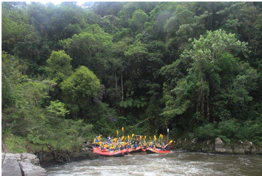
Figura 1 - local da prática do raffting

corredeiras que podem ser visitadas. A prática de “raffting” é comum no parque e um grande potencial de uso público, por isso, tem-se a necessidade da execução de um píer dentro de todas as condições e atendimentos às normas de segurança estimados aos equipamentos públicos.