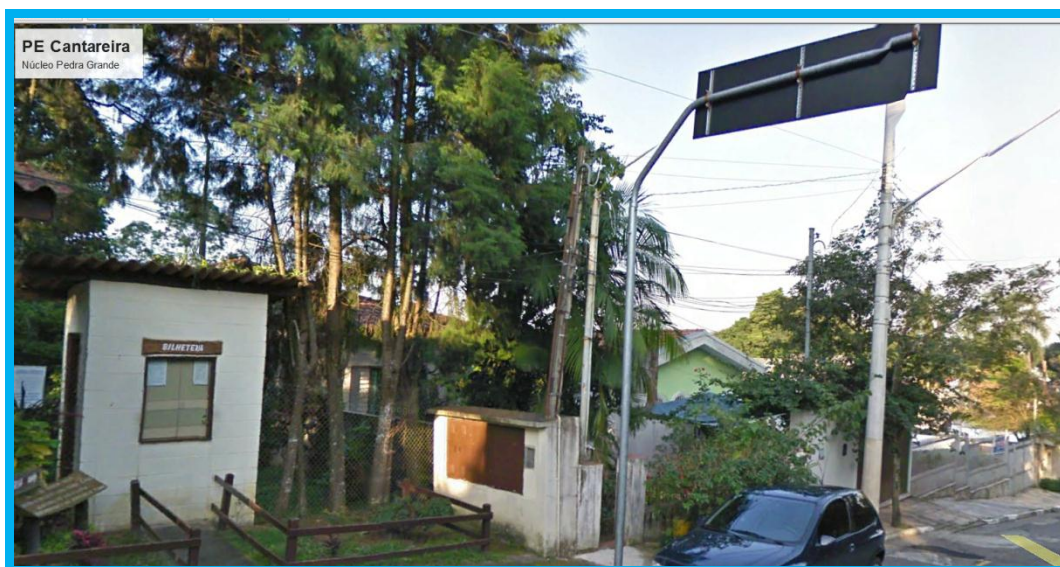
Figura 1 - Fachada na entrada da unidade.

Contratação de serviços de troca de instalação de entrada de energia elétrica no PE - CANTAREIRA, NÚCLEO PEDRA GRANDE, situada à Rua do Horto, 1.799, Horto Florestal, 02.377-000 São Paulo.