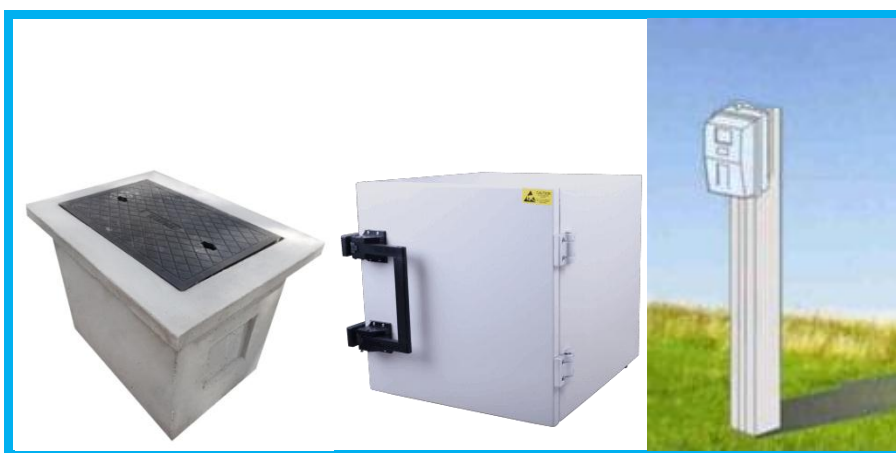
Figura 2 - Caixa de passagem hermética, caixa de distribuição blindada e poste baixo.

Deverá ser executada a confecção de caixa de distribuição em alvenaria ou pré-moldada em concreto hermética com tampa em ferro fundido, interligando o poste padrão de entrada de energia elétrica e o poste com a caixa de energia do trailer.