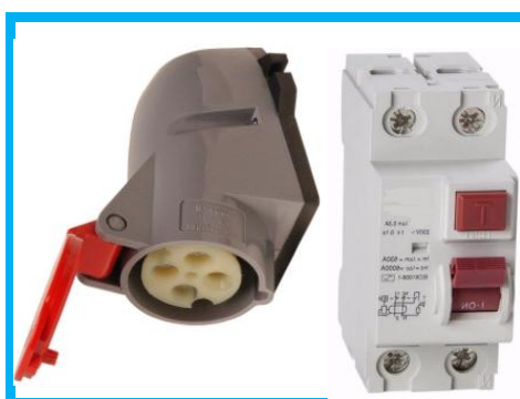
Figura 3 - Tomada 3P+T e Disjuntor DR.

Nesta caixa de distribuição deverá ser instalado um disjuntor DR - Diferencial Residual de 30mA, que acionará uma tomada de potência blindada e externa para alimentar o trailer, esta caixa deverá ter alças laterais com cadeado, deverá ser do tipo externa ao tempo, deverá ser à prova de chuva e pintada com epóxi.