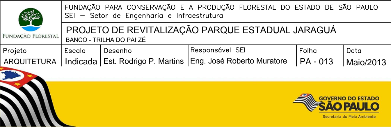
CORTE LATERAL DO BANCO Esc: 1:10

BANCO EM MADEIRA DE EUCALIPTO CITRIODORA TRATADO EM AUTOCLAVE, COM CCA.