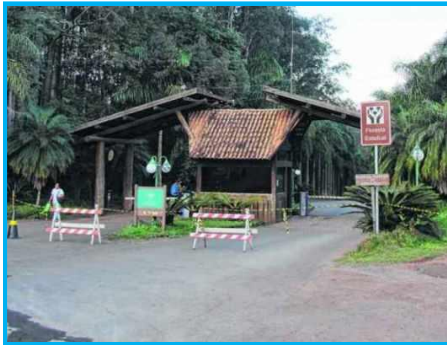
Figura 1 - Localização da entrada da unidade.

Contratação de Serviços de Instalação de Rede de Dados e Telefonia na FEENA – Florestal Estadual Edmundo Navarro de Andrade, situado na Avenida Navarro de Andrade, s/ nº, Vila Paulista, 13506-820 Rio Claro, SP.