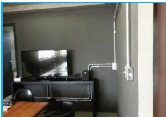
Figura 2 - Eletroduto aparente branco.

Instalação de eletroduto rígido branco, externos, desde o rack, existente no centro da edificação, até os pontos de utilização dos usuários. Uso de conduletes para a instalação de tomadas RJ45 e RJ11 na área interna.