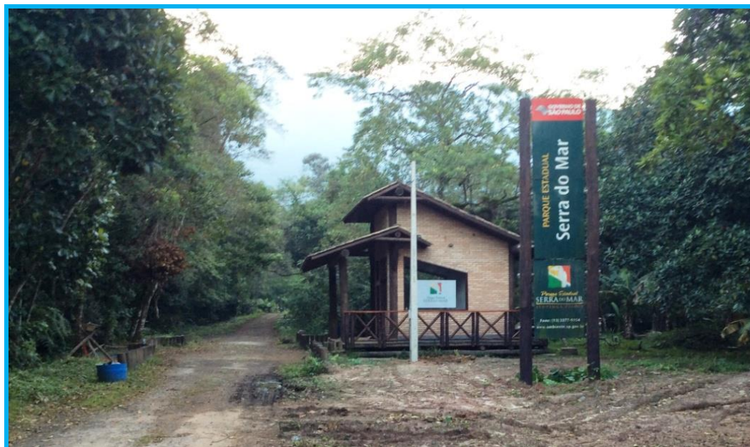
Figura 2 - Entrada da Unidade - Guarita.