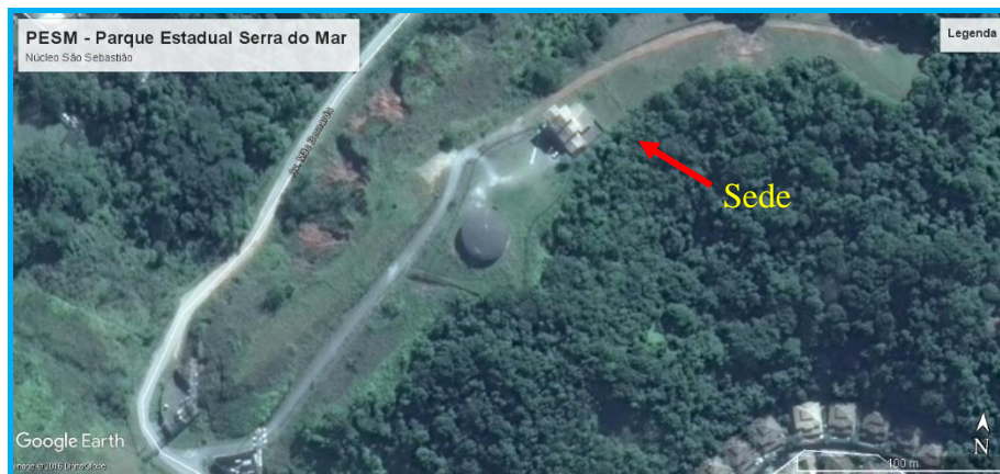
Figura 1 – Localização dos serviços de reforma via satélite.

Execução de Obras de Reforma de Telhado, Alvenaria e Instalações Elétricas no PESH - Parque Estadual Serra do Mar, Núcleo São Sebastião, localizado na Rua Serra do Mar, 13, Juquehy, 11.600-000 São Sebastião.