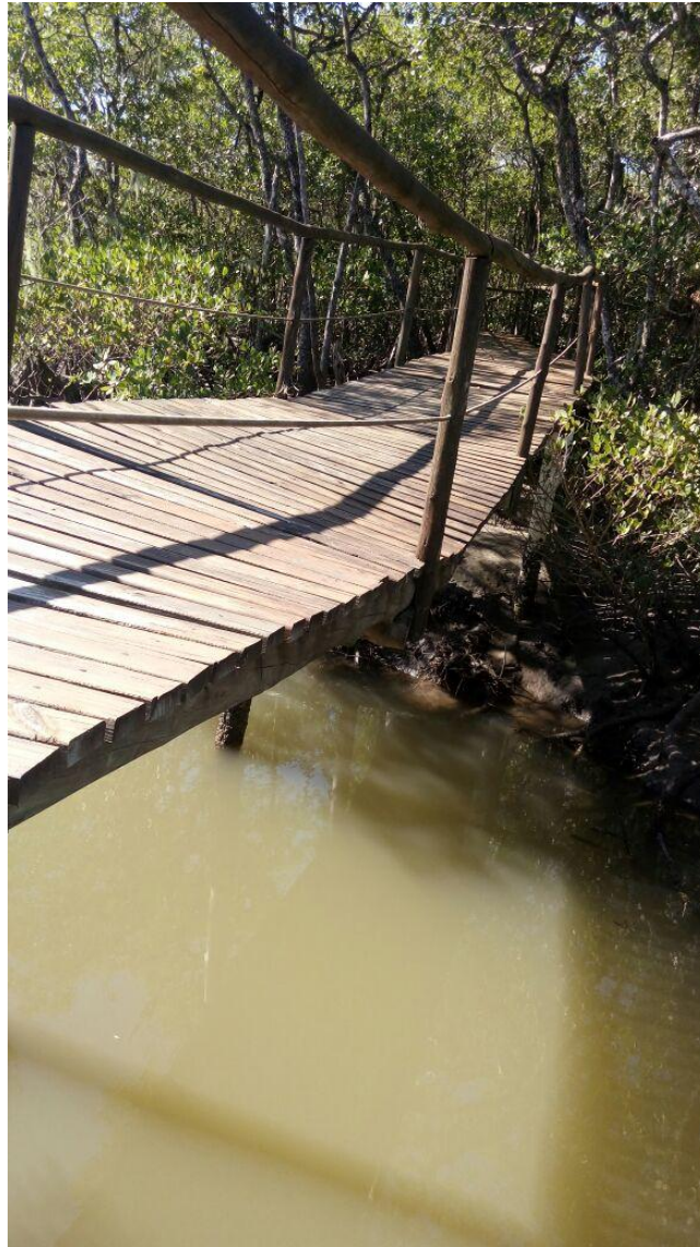
Fotos 03 – Foto da passarela com ausência de pilares de sustentação.