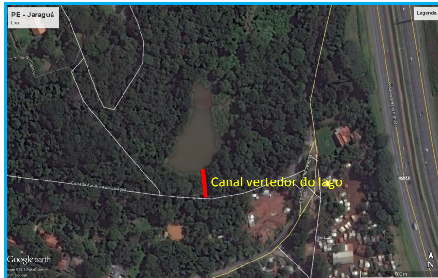
Figura 1 – Localização dos serviços de reforma e contenção via satélite.

Contratação de Serviços de Execução de Obras de Reforma de Vertedor e Contenção de Margens de Lago no PEJ - Parque Estadual Jaraguá, localizado na Rua Antônio Cardoso Nogueira, 539, Vila Chica Luiza, 05184-000 São Paulo.