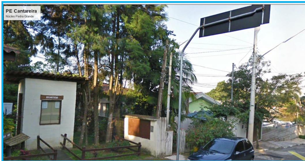
Figura 1 - Localização do padrão de entrada da unidade.

Contratação de serviços de troca de instalação de entrada de energia elétrica no PE - CANTAREIRA, NÚCLEO PEDRA GRANDE, situada à Rua do Horto, 1799, Horto Florestal, 02377-000 São Paulo.