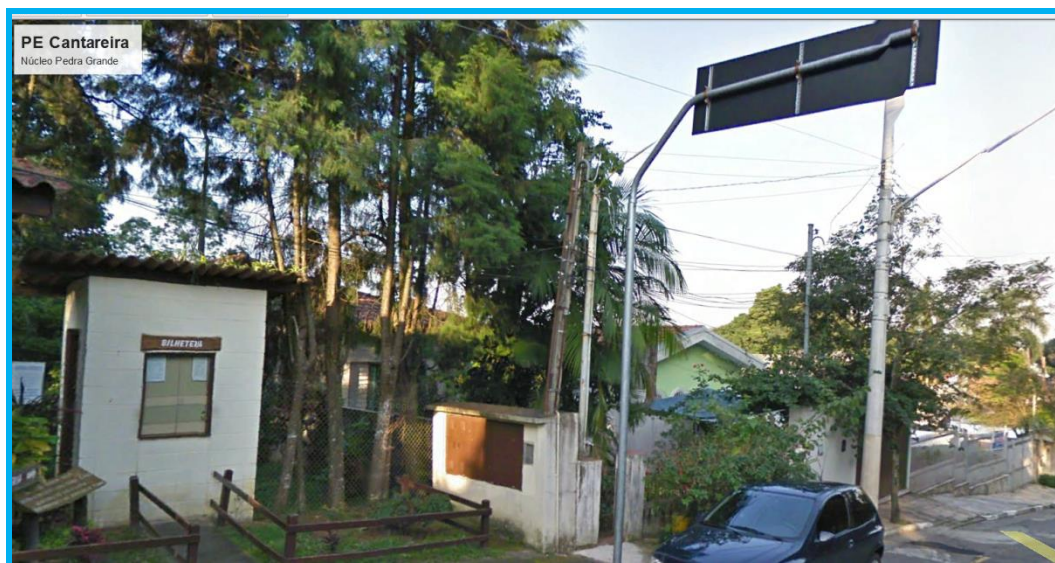
Figura 1 - Localização do padrão de entrada da unidade.

Contratação de serviços de troca de instalação de entrada de energia elétrica no PE - CANTAREIRA, NÚCLEO PEDRA GRANDE, situada à Rua do Horto, 1799, Horto Florestal, 02377-000 São Paulo.