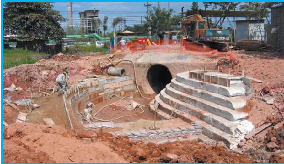
Figura 3 - Exemplo de uso de bolsas de concreto (Rip-Rap) em sistema de drenagem.

A outra parte da recuperação consiste em demolição do piso em concreto e mureta uma vez que as mesmas encontram-se deterioradas pelas infiltrações e erosões.