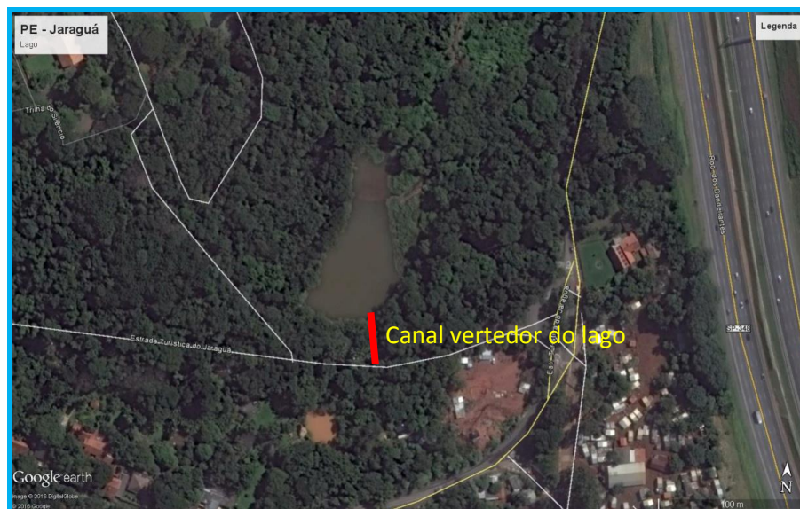
Figura 1 – Localização dos serviços de reforma e contenção via satélite.

Contratação de Serviços de Execução de Obras de Reforma de Vertedor e Contenção de Margens de Lago no PEJ - Parque Estadual Jaraguá, localizado na Rua Antônio Cardoso Nogueira, 539, Vila Chica Luiza, 05184-000 São Paulo.