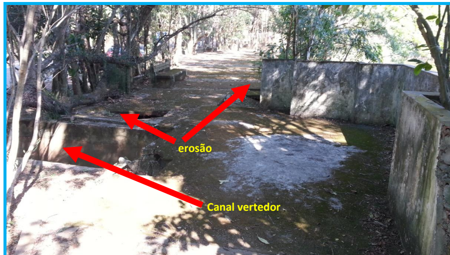
Figura 2 - Fotos do local a ser recuperado.

Há uma caixa de passagem de energia elétrica que está situada no caminho do vertedouro e sempre sofre inundação, podendo causar risco de choque elétrico em pessoas.